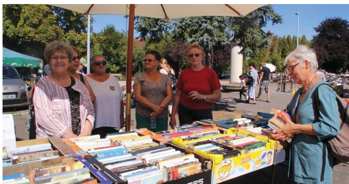
La Médiathèque d'Esprels tiendra un stand à la brocante