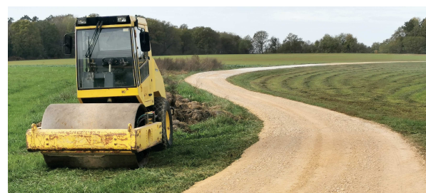
La préparation du Chemin de Montbregil était terminée le 28/10. Suite à de nombreux passages irrespectueux, le lundi 31/10, le travail est à refaire avant la pose de l'émulsion...