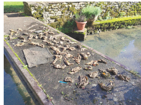
Lingettes pêchées dans le ruisseau devant une maison rue Bachin.

Nous avons engagé les travaux pour le passage en séparatif des canalisations dans le but de mieux protéger notre environnement mais nous comptons également sur un comportement plus respectueux de nos concitoyens.